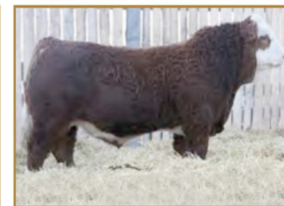
Fils vendu 26 000 $ en 2009