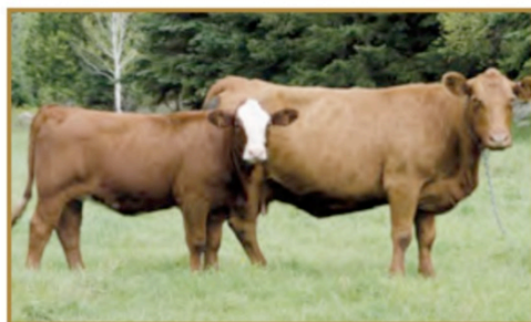
Claude Guillemette, Saint-Malachie (veau)