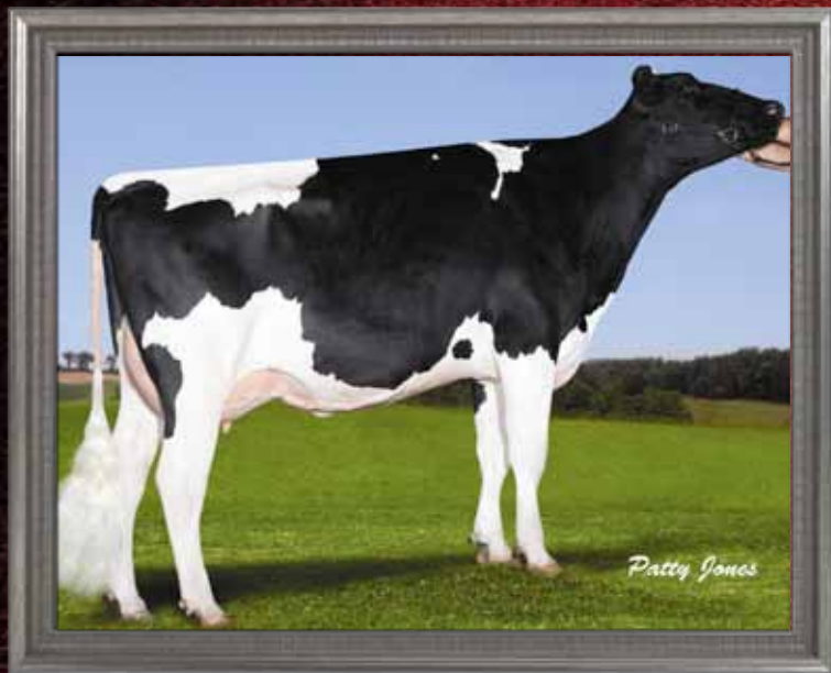
MCCUTCHEON SPECTRUM DINILAH NC MCCUTCHEON HOLSTEINS, THORNDALE, ON

2-03 305 10888 3,9% 429 3,4% 370 kg Prod. à vie 11 622 4,0% 468 3,4% 400 kg