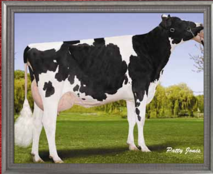
ROYALDAWN SPECTRUM LAURE TB85-2A ROYALDAWN FARM, MITCHELL, ON