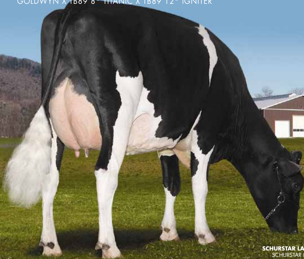
SCHURSTAR LAVANGUARD ALBANY TB85-2A SCHURSTAR DAIRY INC., ABBOTSFORD, CB

GOLDWYN X TB89 8* TITANIC X TB89 12* IGNITER