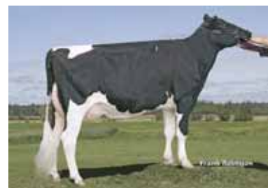
BELAN SUNNY RAPTOR TB85-2A 2.02 305 9954 kg 4.2 % 3.2 % P (238-273-238) proj. Ferme Belan Holstein inc., Saint-Victor, Québec