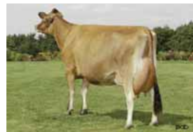
▲ Piedmont Declo Belle EX-94 2* Mère de Lencrest Blackstone

200JE00439 Du Fjord Saguenay-ET (Norval Acres Plaudit x Lencrest Fprize Belle)