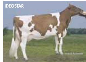
DE FRASERVILLE MONICA TB85-2A 2-03 305 8570 kg 4,2 % 3,3 %P (285-286-285) proj. Ferme Rioux et Frères inc., Rivière-du-Loup, Québec

En promotion du 20 août 2008 au 12 janvier 2009