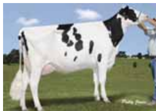
ELOCROFT LIGHTNING KAYLYNN TB85-2A 2-04 305 7884 kg 3,3 % 3,2 %P (190-168-189) proj. Benschop Farms, Bowmanville, Ontario

Un indice de +15 en conformation pousse Sir Linerway LIGHTNING-ET à la position de tête parmi les fils de Stormatic éprouvés au Canada. Il suit les traces de son père avec des indices exceptionnels pour le pis et les pieds et membres et il se démarque pour la puissance laitière (+11). Ses indices sont également très favorables pour la plupart des caractères fonctionnels, surtout pour la fertilité des filles et l'aptitude au vêlage. Il s'agit d'un fils de Formation Larana, un membre de la famille de Laurie Sheik et propriété de la ferme Lesperron, Bury. Il est le résultat d'un embryon exporté aux É.-U., d'où son préfixe différent.