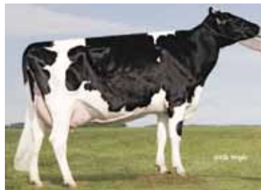
FABERDALE KINGLY 1078 BP82-2A Faberdale Dairies, Tees, Alberta