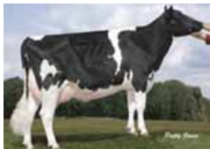
HOWLAND LOBBY NATALIE BP83-2A 2-01 305 7637 kg 3,8 % 3,3 %P (189-197-197) proj. Stone Lane Farms inc., Bright, Ontario