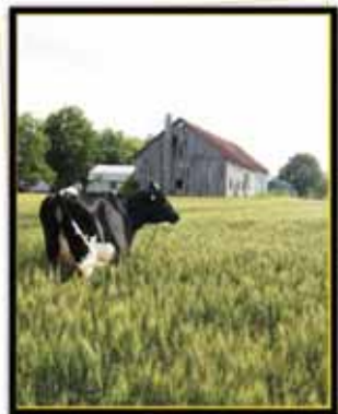
Bourgoie Freelance Gazel, une fille de Braedale Freelance.