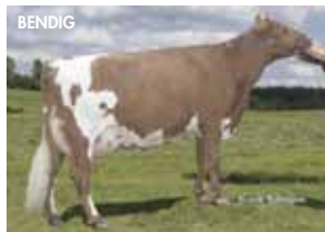
LA SAPINIÈRE DINALIG BP83-2A 2-04 305 9984 kg 4,0 % 2,9 %P (337-326-299) proj. Ferme La Sapinière Ayrshire inc., Saint-Agapit, Québec