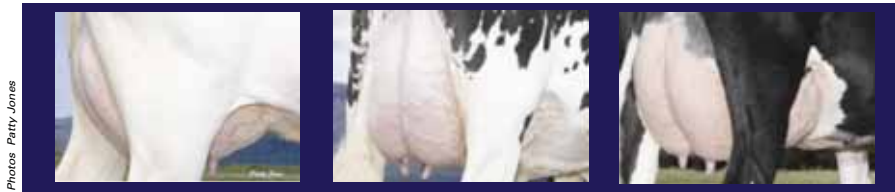
▲ Ashlar : Marcor Ashlar Lorene BP-82-2YR-CAN, Marcor Ashlar Madge BP-81-2A-CAN, Rolleyview Ashlar 491 TB-85-3A-CAN

Les producteurs nous disent que lorsque le temps est venu d'inséminer ces jeunes vaches pendant leur première lactation, les filles d'Ashlar ont rendu leur travail facile – elles ont très bien répondu et elles sont devenues gestantes facilement et