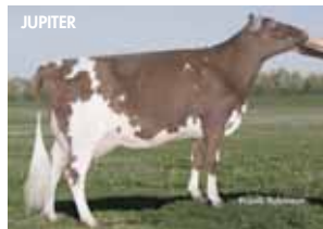
DENIER JUPITER IRIS BP83-2A 2-00 305 8693 kg 4,1 % 3,2 %P (237-292-294) Ferme Denier SENC, Sainte-Claire, Québec

Legacy retrouve la 1 re position selon l'IPV avec une augmentation de 111 points grâce à l'amélioration de sa production et de ses cellules somatiques. Blackstone demeure une vedette au 2 e rang tandis que Senior complète le trio de tête avec 1529 points d'IPV.