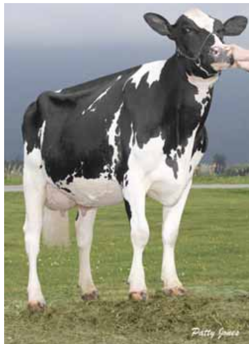
▲ Struys Ashlar Wallace TB-85-4A 3-05 305 11,582 3,8 445 3,0 348 kg (243-254-230) proj.

efficacement. Leur niveau favorable de CS durant leur première lactation était très impressionnant et a augmenté rapidement le sentiment de satisfaction des éleveurs envers Ashlar. Maintenant, à mesure que ses filles entrent dans leur deuxième lactation, la tendance se maintient. Les pis continuent à s'améliorer, ce qui confirme leur statut de vaches avec la longévité souhaitée par les éleveurs. Nous sommes très impressionnés par la façon dont ces vaches se développent à l'avant-train et deviennent de très bonnes vaches dans leurs troupeaux.