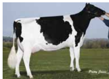
MISSY BAROQUE SMARTY 8P83-2A Missy Holsteins, Moose Creek, Ontario