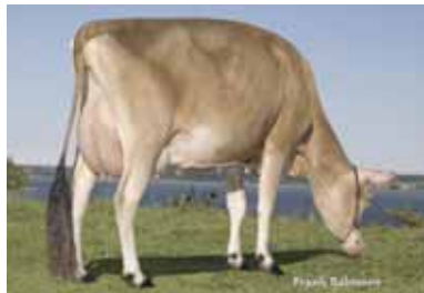
▲ Estran Blackstone Ramone TB-86-2A-CAN Louis Montambault & Élise Alain, Deschambault, Québec

Ces performances, ainsi que son habilité à transmettre son potentiel à sa progéniture, lui ont mérité la reconnaissance de Vache du siècle décernée par US Jersey ainsi que 20 étoiles de Jersey Canada.