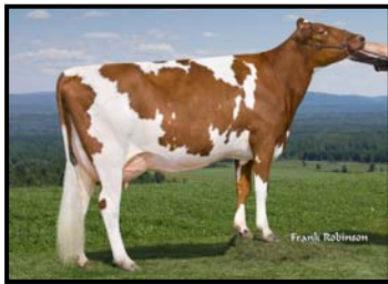
Guimond KO Tonia, TB86-2A 2- 305 7 842kg 4,7 % 3,6 % (261-291-285) proj. Ferme Guimond et Fils enr., Sainte-Blandine, Québec

L'évaluation génétique de Knockout est très élevée pour la production, ce qui le classe au 4 e rang de la race pour les kg de lait et au 5 e rang pour les kg de gras et de protéine. Les filles de Knockout sont très grandes et puissantes, et elles se déplacent sur de bons pieds et membres.