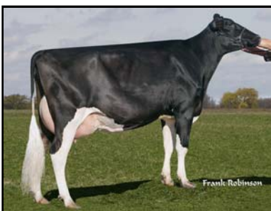
De La Coulée Matrix Sahara, BP83 2-0 305 10511 4,5 % 3,5 % (276)(334)(296) proj. Ferme Coulie inc., Baie-du-Febvre