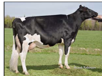
Hectare Knowledge Marielle, BP84 2-0 305 10103 3,9 % 3,2 % (252)(262)(253) proj. Les Hectares Verts inc., Roxton Pond