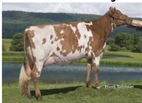
Vachon Reality Corea, BP84-2A Ferme Vachon, Vallée-Jonction

Palmyra Tri-Star Reality (Tri-Star x Lover's) est un taureau peu apparenté qui était très attendu par les éleveurs. Il est extrêmement bien équilibré, tant en ce qui a trait à la production, qu'à la conformation et aux caractères de santé et fertilité. Avec 8 filles TB sur 57 classifiées, Reality montre à quel point il est dominant en conformation. Il s'ajoute donc au groupe d'élite des taureaux Ayrshire offerts par le CIAQ.