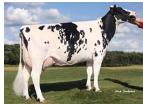
Stone-Ridge Manifold 26182, NC 1-11 244 10729 kg 3,3 % 3,1 %P inc. Stone Ridge Dairy, Mansfield, Illinois, États-Unis

Parmi les taureaux nouvellement éprouvés, Mainstream Manifold se place au sommet de la liste avec un IPV MACE de 2867 points. Manifold fait partie des leaders de la race en production affichant d'extraordinaires indices en gras de 103 kg, +,24 % et en protéine de 80 kg, +,13 %. Ce fils d'OMan qui se classe parmi les meilleurs pour l'aptitude au vêlage (117) et la fertilité des filles (107) surpasse son père pour les pis avec un très respectable +6.