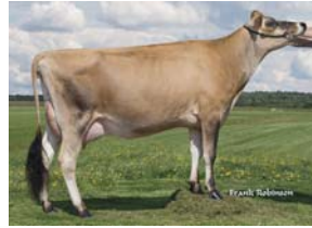
Cessnock Britania On Time, BP83-2A Jacky Champagne, Saint-Honoré-de-Shenley

Lencrest On Time (Sultan x Declo) est notre nouveau taureau qui surpasse les limites déjà établies. Premier de la liste d'IPV, On Time reconfirme le haut potentiel de cette famille avec une évaluation génétique de 1304 kg de lait, 62 kg de gras et 54 kg de protéine. En conformation, On Time dépasse son père pour se situer au troisième rang de la race à +10, ce qui fait de lui une vedette sur toute la ligne.