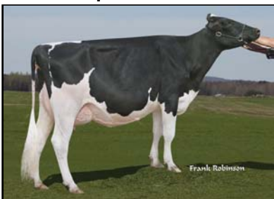
Floroma Sahara Florence, TB86-2A 2-5 9543 4,2 % 3,32 % (224)(254)(231) proj. Ferme Floroma inc., Pont-Rouge